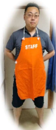
立場上、当日はスタッフエプロンを着用 できない実行委員長。せめて写真だけ も、自宅で試着してご満悦の様子。