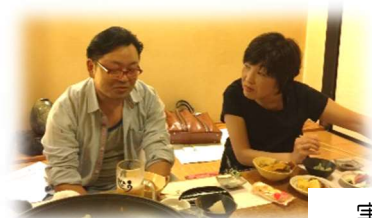
実行委員会だけでも計10回!各担当ごとの打ち合わせや懇 親会も多数開催してきたのでチームワークはバッチリ!